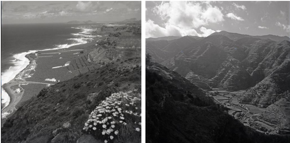
Figura 1.- Fuera del entorno de Las Palmas de Gran Canaria Kunkel se movió pronto por otros parajes de mayor diversidad florística, bien guiado por expedicionarios precedentes o por sus propias exploraciones. Izquierda: costa norte de Gran Canaria desde la Cuesta de Silva, derecha: Barranco de La Virgen por debajo de Valsendero.

Al preparar las carpetas para los pliegos establece dos categorías que señala en la cara externa con circulitos azules o negros. Los primeros indican el contenido de material de plantas que crecen de forma espontánea. Los circulitos negros indican que el material que contiene es de origen cultivado o sub-espontáneo pero no naturalizado. La mayoría de pliegos de plantas naturalizadas o nativas no endémicas las recolecta en las inmediaciones de su laboratorio, circunscritas al municipio de Las Palmas de Gran Canaria. Pero cuando ha de recolectar especies endémicas o nativas en general ha de desplazarse a los lugares oportunos (Figura 1).