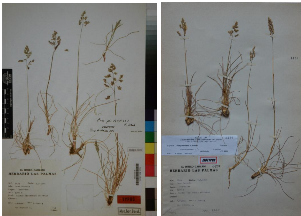
Figura 4.- Izquierda: Holotypus de Poa pitardiana , Herbarium Berolinense, Barcode: B 10 0167933, Ku: 8659. Derecha: Isotypus ( dupliccata del anterior), depositado actualmente en el herbario del Jardín Botánico Canario Viera y Clavijo, LPA: 4420.