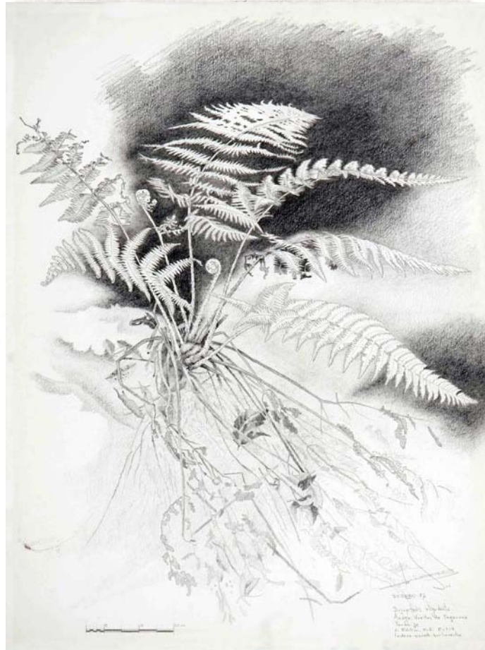
Helecho de monte

Virgen, para completar sus contribuciones al conocimiento de los helechos de esta isla. Y en sus últimas visitas al Jardín Canario preparábamos una contribución conjunta sobre el Asplenium terorense , helecho descrito por Günter Kunkel para las zonas altas de Teror pero actualmente conocido para distintos enclaves de Valleseco y Moya.