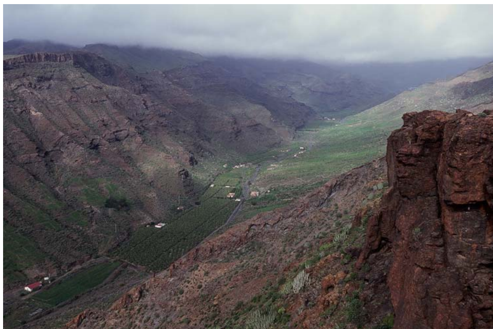
Figura 3.- Barranco de Veneguera, al oeste de la isla de Gran Canaria, desde la rampa de Tabaibales, donde se han localizado núcleos poblacionales de Oropetium .