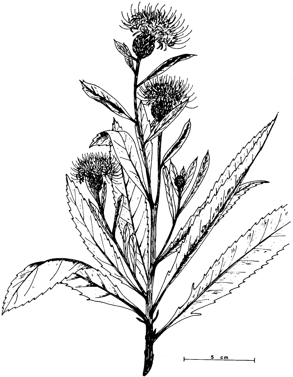
FIGURA 1: Cheirolophus metlesicsii sp. nov.