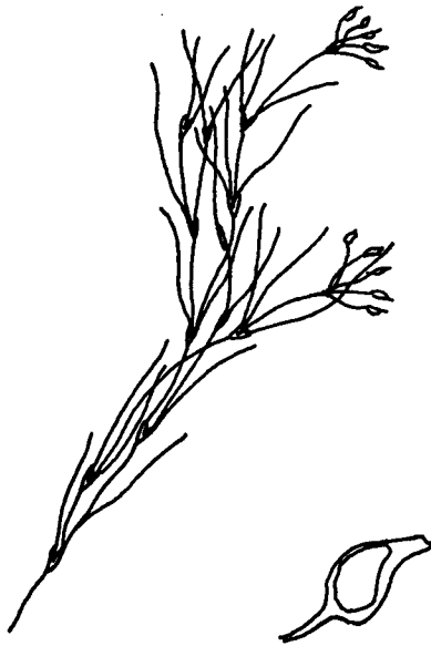
Fig. 3. Ruppia rostellata Koch. x1/3 fructificada. Fruto x1